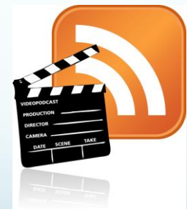
ビデオポッドキャスト