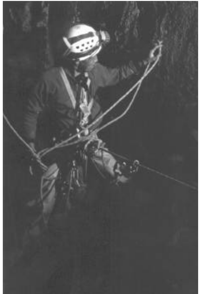
入見穴見戸の穴リギング中