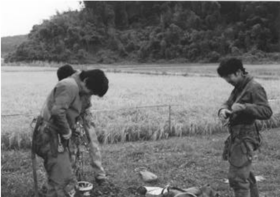
なぜかうれしそう。